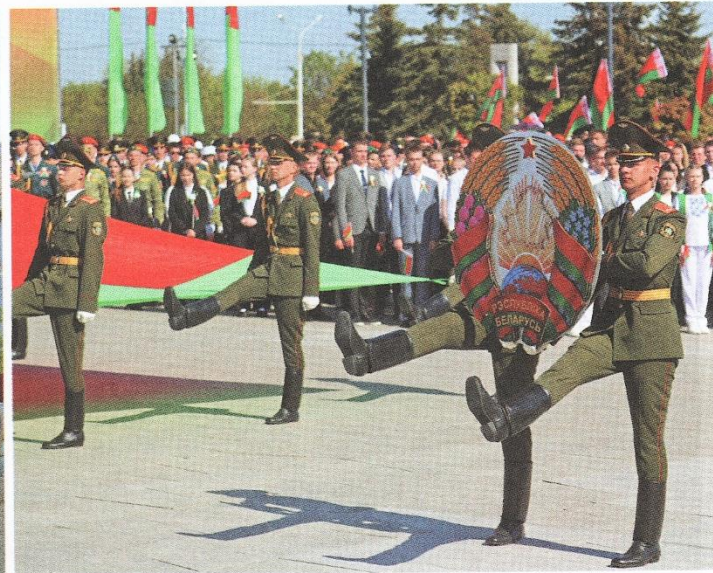
14 мая 2023 года. Плошча Дзяржаўнага сцяга. Торжэственны рытуал чэствавання дзяржаўных сімвалаў

Имеются в виду те песни, где он автор и текста, и музыки. Многие из них глубоко патриотичны. Например, «Беларусь мая сінявокая», которую, по словам поэта, исполнял не только хор Цитовича, но и квартет «Купалінка».