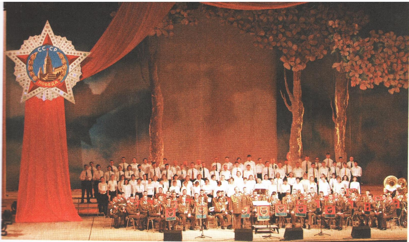
Финальное прослушивание 8 мая 2002 года во Дворце Республики, в ходе которого Президент Александр Лукашенко ознакомился с произведениями, претендующими стать Государственным гимном Беларуси

почему. В музыке, как и других сферах, есть свои законы.