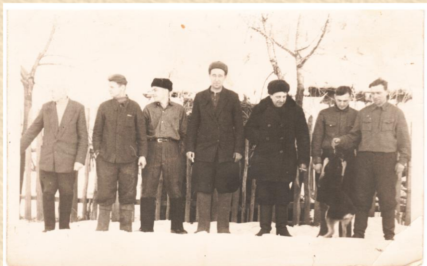
Мужчины с улицы Бачило